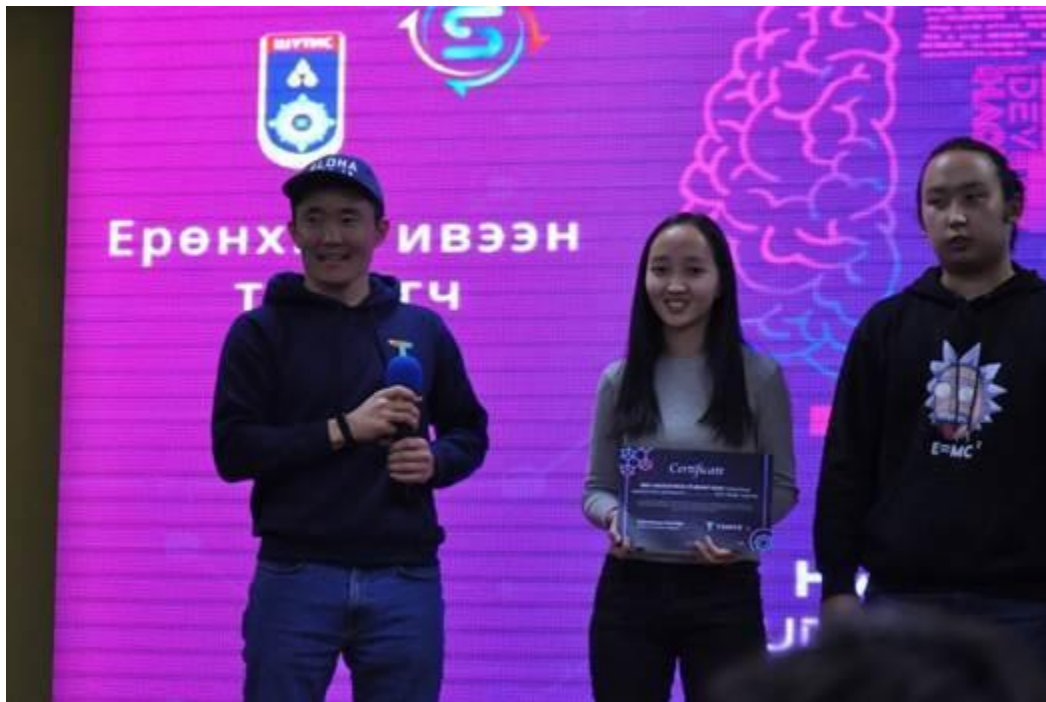
Tomyo Ed Tech тусгай байр: PrimeZ