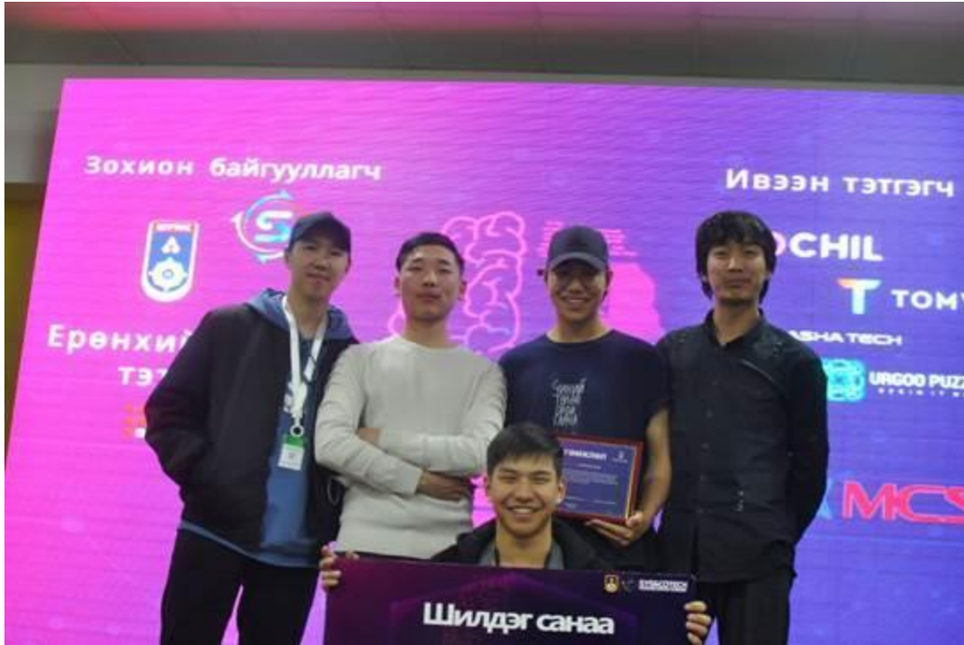
Шилдэг санаа: Болжморууд