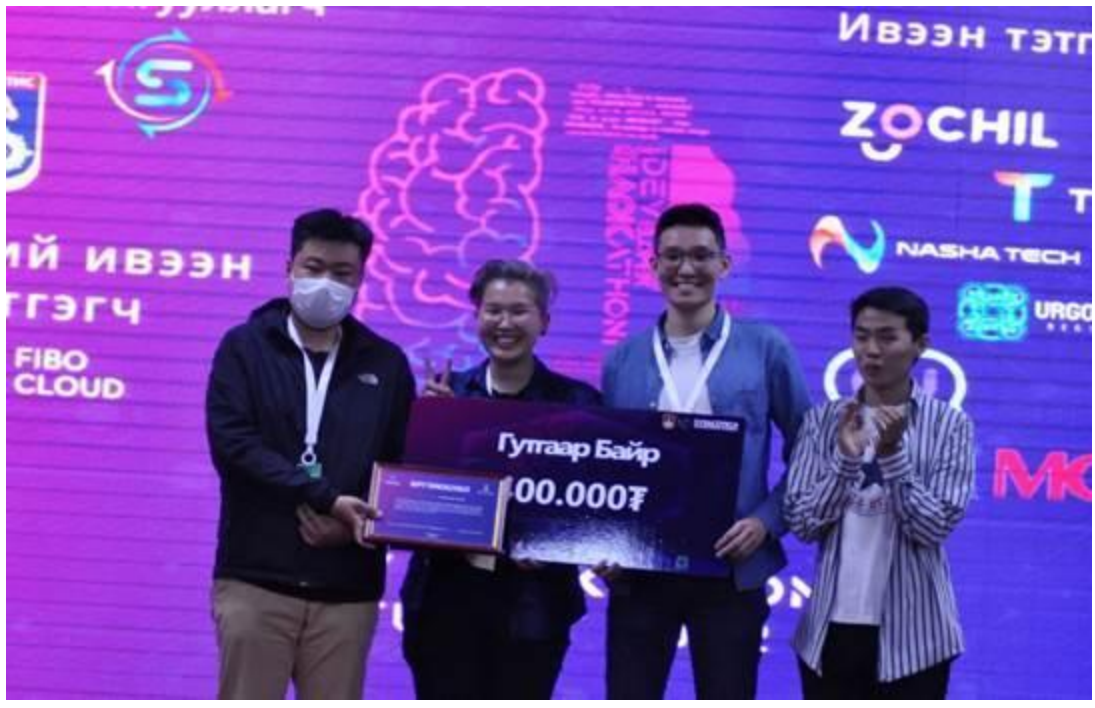
Гуравдугаар байранд: GOONTEX