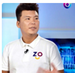
Г. Батбилэг/CEO, Founder of Zochil shop/