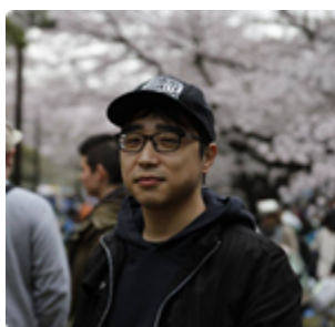
Б. Билэгсайхан/ML Engineer of And global/