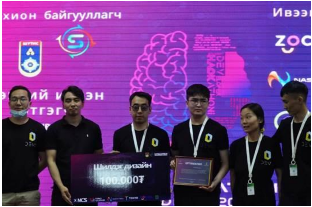
Шилдэг загвар: Devo