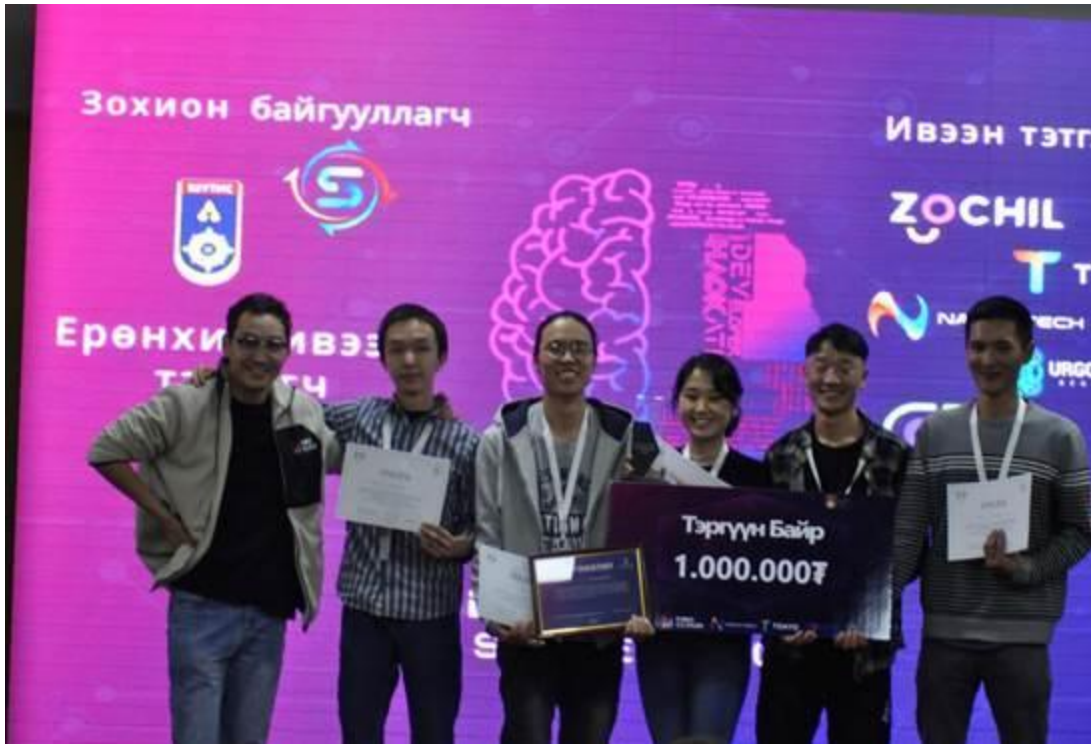
Тэргүүн байранд: Pentium 5