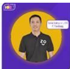
Г. Ганболд/Zochil СТО технологи хариуцсан захирал/