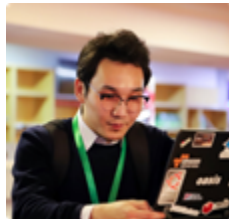
Н. Ганжигүүр/Fibo global-хамтран үүсгэн байгуулагч/