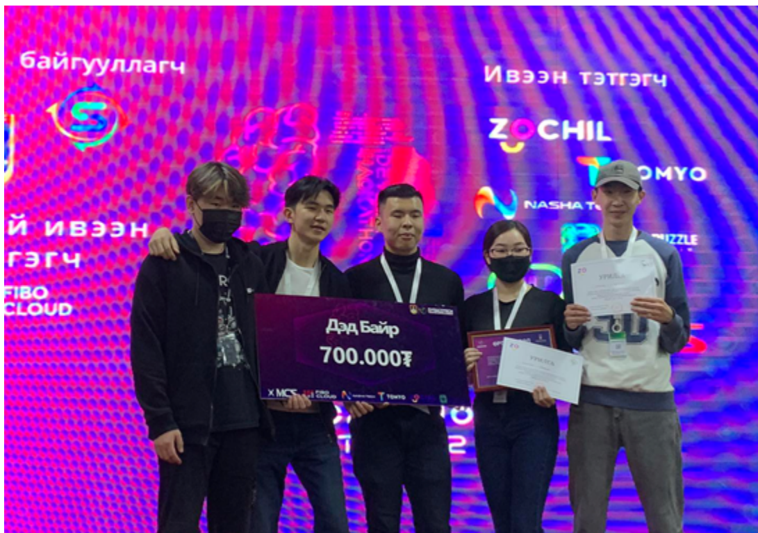
Дэд байранд: Ecompreneur